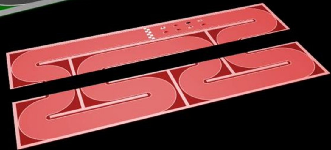
2 loies de 2m x 10m